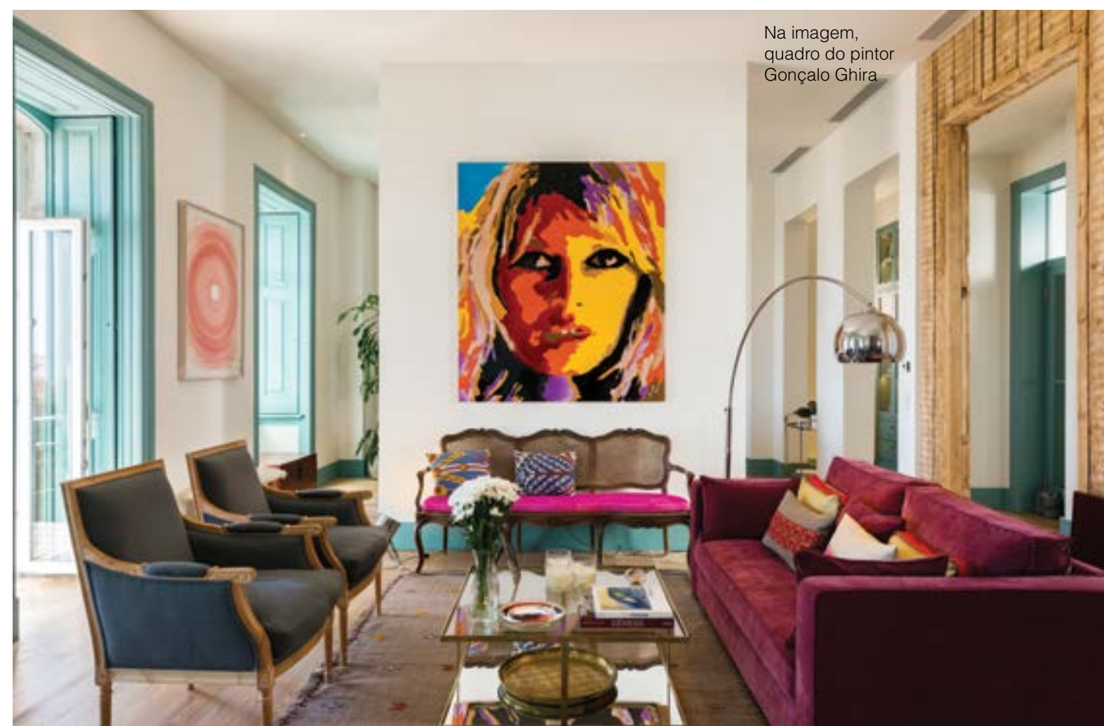
Na imagem, quadro do pintor Gonçalo Ghira